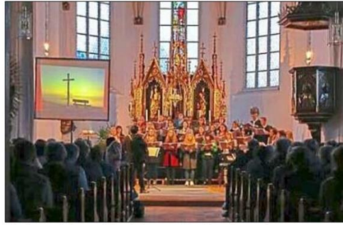
Kinder- und Jugendchor laden zum Passionssingen ein.

Es wird gesungen von dem, was das Leben fest und stark macht; was Wurzeln hat und wachsen lässt. Da ist die Rede vom Mut, immer wieder von Neuem zu beginnen. Aber auch die Bitte um den Segen Gottes. Schließlich wird in einer Art Fürbitten die Not, das Leid, das Elend dieser Welt angesprochen und so symbolisch