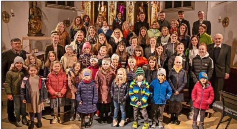
Der Kinderchor und der Jugendchor Staudach begeisterten die Zuhörer.

Jugendchor und Kinderchor sangen gemeinsam „Eingeladen zum Fest des Glaubens“ und das Themenlied „Von deiner Liebe“, wobei man die Freu-